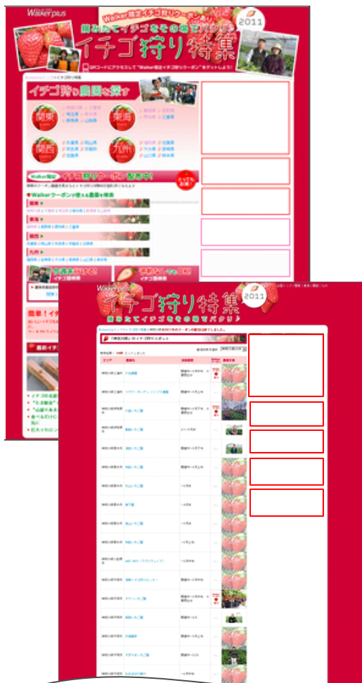
特集エリアTOP 以下詳細面